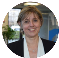
Sylvie Retailleau Présidente de l'Université Paris-Saclay

HUMANISTE , celle de permettre à toutes et tous de relever les défis de demain en poursuivant des études supérieures.